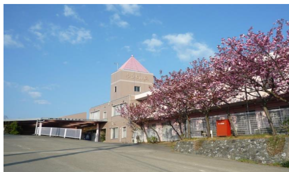
特別養護老人ホーム ももよの丘