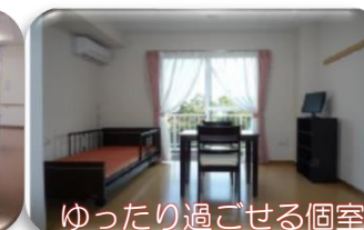
ゆったり過ごせる個室