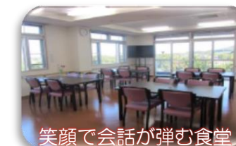
笑顔で会話が弾む食堂