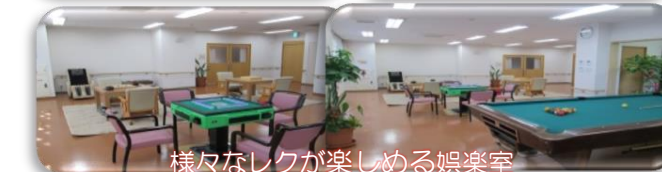
様々なレクが楽しめる娯楽室